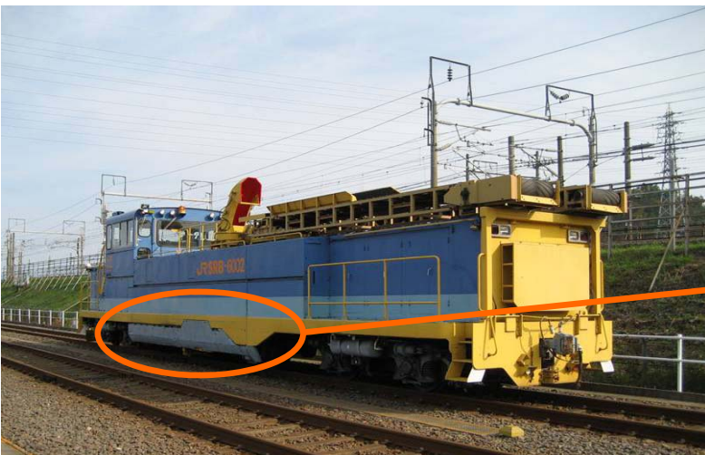
図2 除雪機械（ロータリーブラシ式）