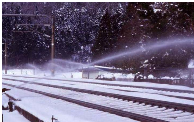
図4 スプリンクラーによる散水