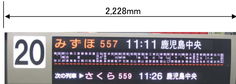
[図3]乗車口案内掲示器