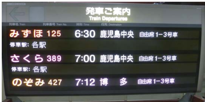
[図1]ホーム・コンコース発車標