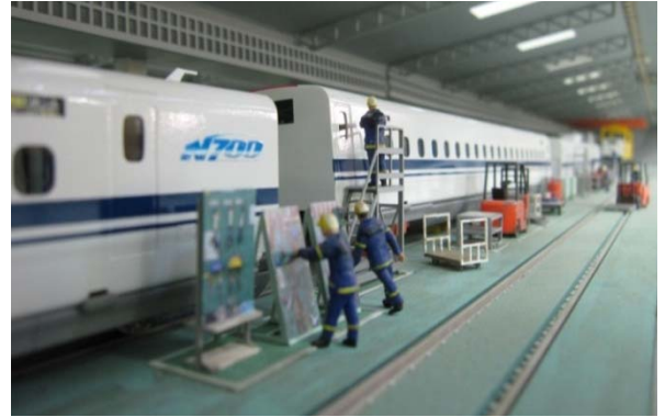
〔鉄道ジオラマ〕（浜松工場をイメージ）