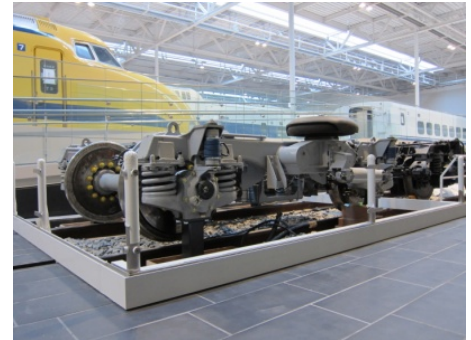
〔鉄道のしくみコーナー〕（300系台車）