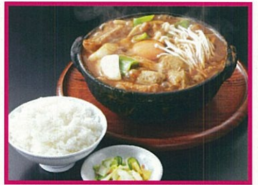
山本屋総本家 煮込みセット(100食限定) 1,470円(税込)