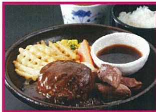
俵屋じゅう兵衛 (税込) 俵ハンバーグ <ライス、スープ付> &サイコロステーキ 1,480円