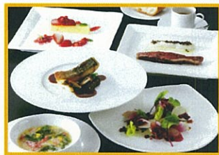
キハチ ※ディナータイム:サービス料10% Pleasure (プレジャー) 6,300円(税込)