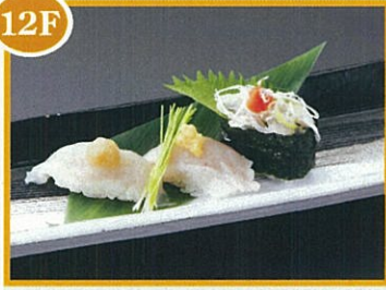
名古屋市場直送 寿司嘉文 とらふぐの食べくらべ 660円(税込)