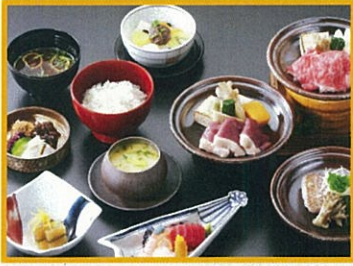
浅田・伊兵衛(テーブル・カウンター席) ※伊兵衛のみのご提供 お好み陶板 4,800円(税込) ※和牛すき鍋、鴨治部、のど黒煮付けの中から メイン料理をお選びください。