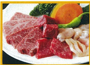
炭火焼肉トラジ 2,300円(税込) 赤肉、白肉7点盛り(税込) ※ディナータイム:サービス料10%