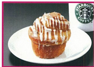
スターバックスコーヒー シナモンロール 280円(税込) ※数量限定の為、無くなり次第終了となります。