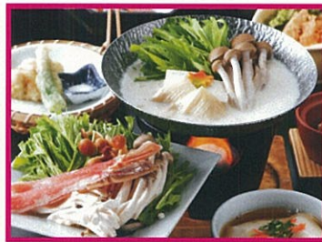
豆富百珍 八かく庵 特選 豆乳カニしゃぶコース 「京三味」 3,980円(税込)