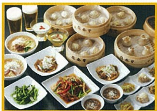
鼎泰豊 (ディン・タイ・フォン) おすすめコース <ドリンク付> 1名様 3,800円(税込) ※ディナーのみ

※写真はイメージです。 ※仕入れの状況により内容を変更する場合がございます。 ※メニューの詳細につきましては店舗にご確認下さい。