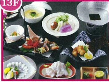
加賀屋 雪会席(フグ尽くし) 6,000円(税込)