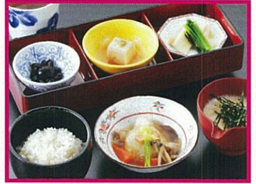
安全・安心・健康さんる一む 冬の京都おぼんざい御膳 1,240円(税込) ※ソフトドリンクまたは グラスワイン1杯付