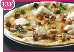
13F マリーノ・マツジョ 焼りんごとさつま芋のピッツァ 1,300円(税込)