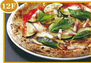
12F デリツィオー・ソイタリア・エピス トーキョー ピッツァ「レガール」 ※ディナーのみ 1,000円(税込) ※数量限定のため、1組1枚まで