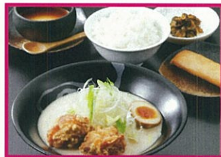
江南 ※17時より販売 丸鶏柳麺セット 1,200円(税込)