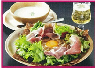
ブレッツカフェ クレープリー Menu anniversaire (△メニュー・アニヴェルセル) 1,680円(税込)