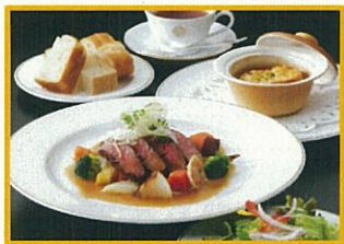
資生堂パーラー 3,465円(税込) 飛騨牛のステーキと オニオングラタンスープセット ※コーヒーor紅茶付