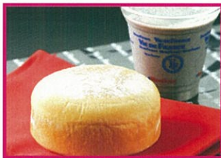
ヴィドフランス エンジェルソフト+ 豆乳黒ごまバナナジュースセット 500円(税込)