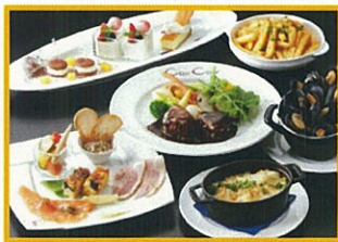
ピストロ&ピアカフェ カンカル カンカルセット 1名様2,980円(税込) ※ディナー限定 ※ご注文は2名様から。 ※写真は2名様分です。