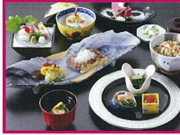
なだ万茶寮 ミニ懐石 5,300円(税込サ別)