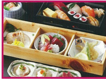
すし 桂 旬彩 2,625円(税込)