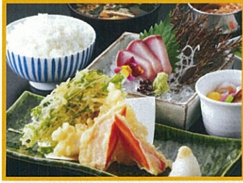
大かまど飯 寅福 京野菜天麩羅と寒ぶりの お刺身御膳 1,980円(税込)

※写真はイメージです。 ※仕入れの状況により内容を変更する場合がございます。 ※メニューの詳細につきましては店舗にご確認下さい。