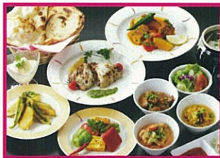
マハラジャ ※写真は2名様分です。 アニバーサリーコース <ドリンク付>2名様3,250円(税込)