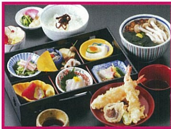
美々卵(ミミウ) 美々卵弁当 1,980円(税込) ※17時以降サービス料10%