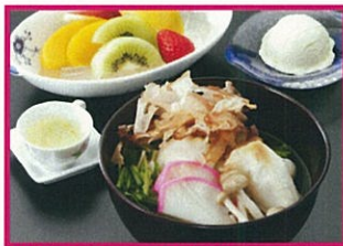
艸花庵 養老軒 祝年華 1,300円(税込)