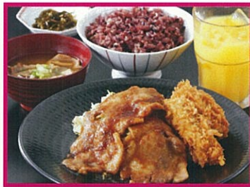
黒豚しゃぶしゃぶと芋焼酎 黒豚庵 黒豚のしょうが焼きとカキフライ定食 ※ランチ限定 1,080円(税込) ※お好みのランチドリンク1杯サービス