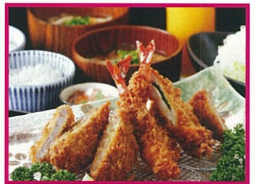
とんかつ 恵亭 特別ペアセット 2名様 ¥2,980(税込)