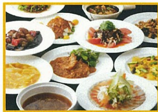
スーツァンレストラン陳 スーツァンセット 8,800円(税込) <2~4名で楽しむセット> ※お好きな品をお選びいただけます ※サービス料:昼5%、夜10%