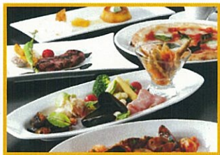
ザ キッチン サルヴァトーレ・クオモ キッチンスタイルbuffetランチ ※ランチのみ 2,800円(税込)