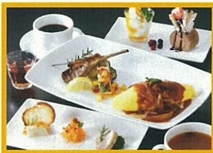
京たまごキッチンモレット モレットサンクスコース ※ディナー限定 2,000円(税込)