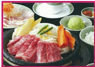
三田屋本店 -やすらぎの郷- 飛騨牛ステーキコース (サーロイン150g)5,250円(税込)