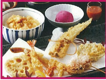
天ぷら新宿 つな八 10周年記念特別献立 3,675円(税込)