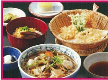
東京杉並 やぶそば 冬味膳 1,890円(税込)