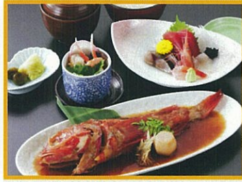
魚がし料理 嘉鮮 特大きんきの煮付定食 2,200円(税込)