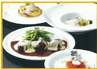
ブラスリー ボール・ボキューズ ラメゾン タワーズプラザ 5,800円(税込) × ボールボキューズ 10周年記念メニュー ※+380円でコーヒーまたは紅茶