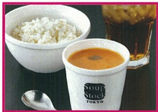
スープストックトーキョー レギュラーカップドリンクセット <パンまたはライス、ドリンク付> 960円(税込)