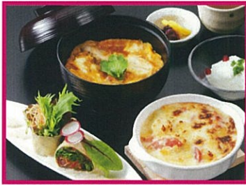
とり五鐵 2,100円(税込) 名古屋コーチン親子丼と あったか豆乳グラタン