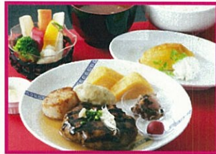
ダイナー キルロイズ 飛騨牛ハンバーグ御膳 2,100円(税込)