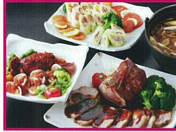
元気になる農場レストラン モクモク からだも心もあたたまる 農場のごちそう料理 (税込) ランチ: 1,850円 ※一部ディナーのみのご提供 デイナー: 2,800円