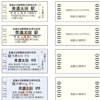
美濃太田駅開業 90 周年記念乗車券(硬券)(イメージ)

美濃太田駅の入場券や乗車券がセットになった「美濃太田駅開業 90 周年記念乗車券（硬券）」を発売します。