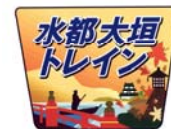
ヘッドマーク(イメージ)