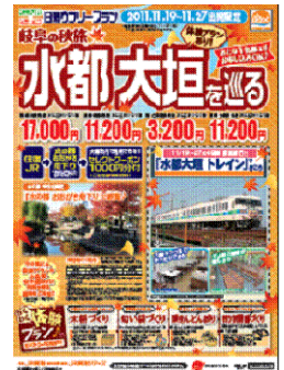
パンフレットイメージ