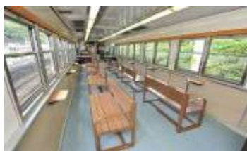
2号車(ウィンディスペース)車内(イメージ)