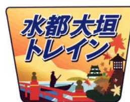
ヘッドマーク(イメージ)