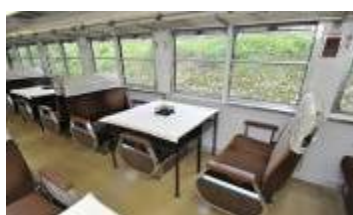
1・3・4号車内(イメージ)

2号車「ウィンディスペース」…ご乗車のお客様が自由にご利用になれるスペース。沿線の景色等を体験できるよう窓向きにベンチを配置し、乗降扉に代わって展望柵があります。