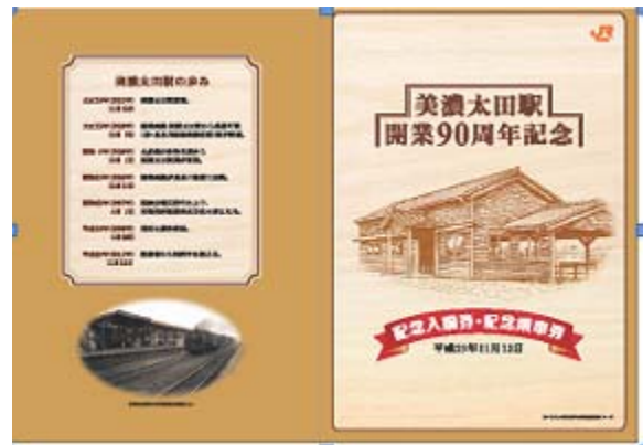
美濃太田駅開業 90 周年記念乗車券(硬券)の台紙(イメージ)