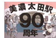
ヘッドマーク(イメージ)