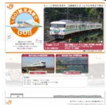
J R 東海観光列車ホームページ (イメージ)