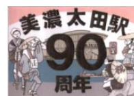
ヘッドマーク(イメージ)