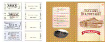
美濃太田駅開業90周年記念乗車券(硬券)イメージ

美濃太田駅の入場券や乗車券がセットになった「美濃太田駅開業90周年記念乗車券(硬券)」を300セット限定で発売します。