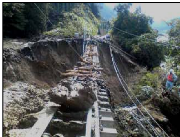
③芝川駅～稲子駅間 斜面崩壊による第二湯沢トンネル内等への土砂流入