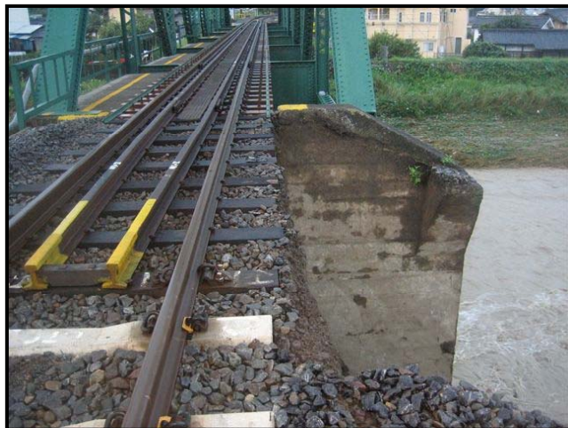
①市川本町駅～芦川駅間 芦川橋りょう橋台裏の洗掘