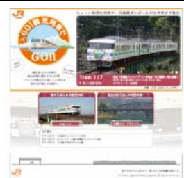
「GO!観光列車でGO!!」 ホームページ (イメージ)

http://shupo.jr-central.co.jp/train/index.html