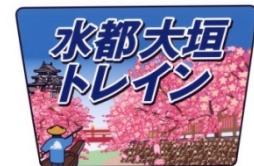
ヘッドマーク(イメージ)

※下り列車の車内では、プレゼント・観光案内パンフレットの配布などを行う予定です。