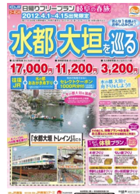
パンフレット (イメージ)

○ 詳しくは、 専用パンフレット またはJR東海ツアーズのホームページをご覧ください。 http://www.jrtours.co.jp