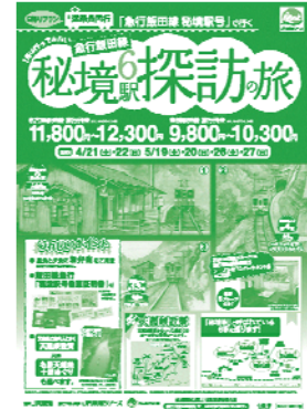
パンフレット（イメージ）

○ 詳しくは、専用パンフレットまたはJR東海ツアーズのホームページをご覧ください。 http://www.jrtours.co.jp