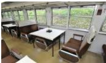
1・3・4号車内(イメージ)

2号車「ウィンディスペース」…ご乗車のお客様が自由にご利用になれるスペース。沿線の景色等を体験できるよう窓向きにベンチを配置し、乗降扉に代わって展望柵があります。