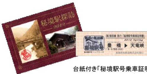
台紙付き「秘境駅号乗車証明書」 <下り>(イメージ)