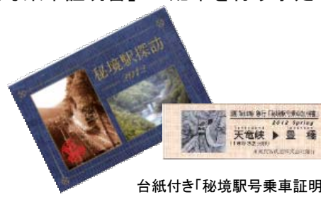
台紙付き「秘境駅号乗車証明書」 <上り>(イメージ)