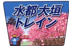
ヘッドマーク(イメージ)