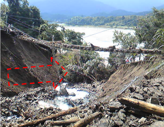
台風15号の際にできた新たな水道 みずみち