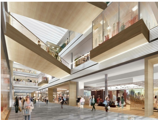
歩行者通路（2階）イメージ