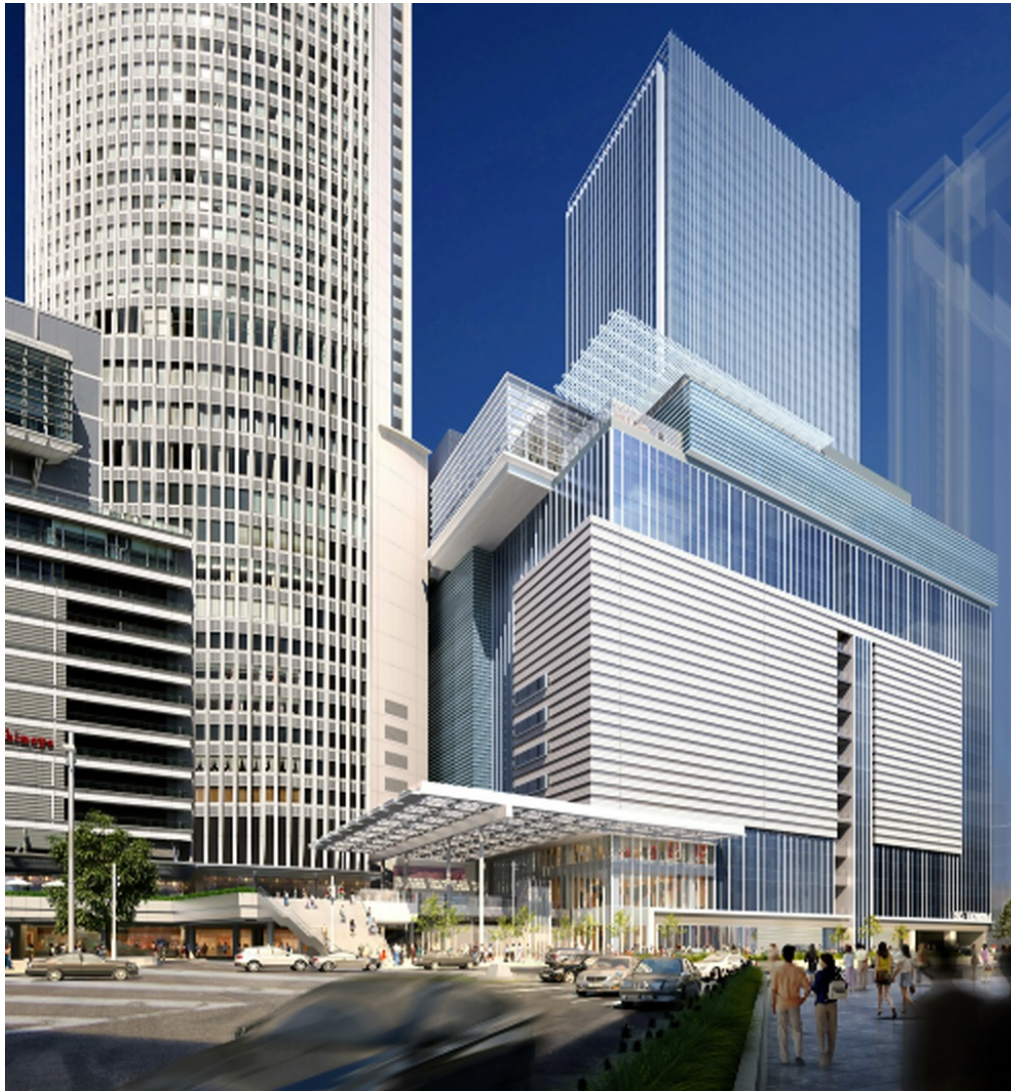
外観（東側）イメージ