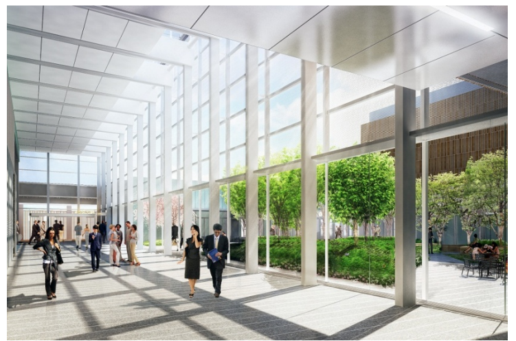
スカイストリート・中庭（15階）イメージ