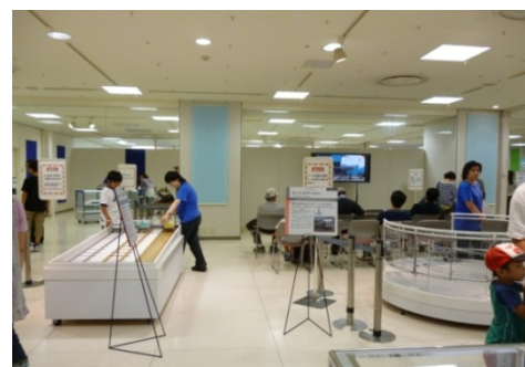
昨年の「リニア・鉄道館コーナー」の様子