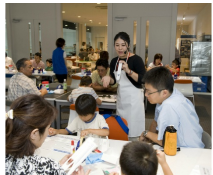
今年のイベントの様子（ペーパークラフト）

■その他：ペーパークラフトは夏休みイベント期間中、総合案内でも購入することができます。