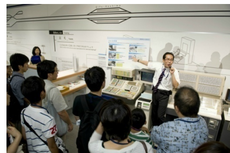
昨年イベントの様子（M型端末での発券体験）