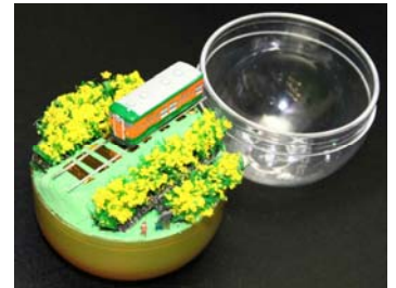
展示車両ストラップのパーツを使ったデコレーションの工作例 ※作例紹介のみとなります。 ※キットでの販売はありません。