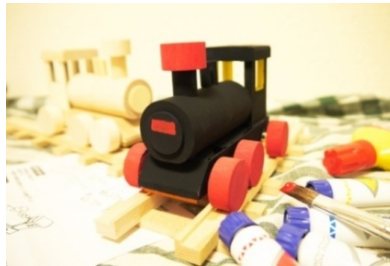
木工車両キット 800円(税込) ※写真手前のSLは着色例です。 ※絵の具等は商品には含まれません。