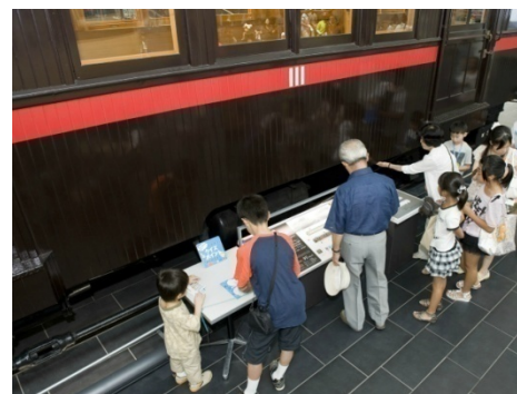
昨年イベントの様子(スタンプラリー)