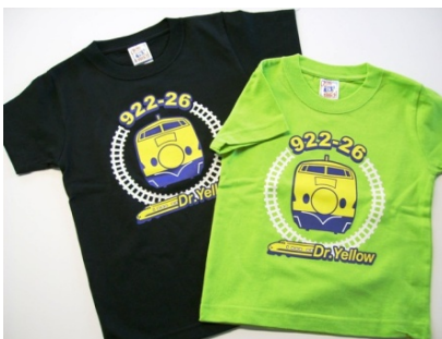
【キッズTシャツの一例】