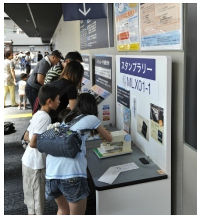
昨年のイベントの様子（左：浜松工場「新幹線なるほど発見デー」、右：リニア・鉄道館 館内）