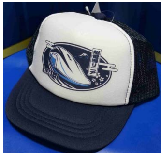
【キッズキャップの一例】