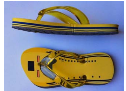
【キッズビーチサンダル(ドクターイエロー)】