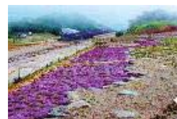
白馬五竜高山植物園 (イメージ)

※「信濃路フリーきっぷ」でも9月1日~9月30日まで限定特典としてご利用できます。