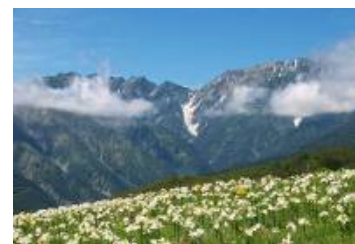
岩岳ゆり園 (イメージ)

※「信濃路フリーきっぷ」でも7月14日~8月31日まで限定特典としてご利用できます。(ただし、8月11日~20日は除きます。)