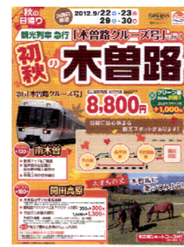
パンフレットイメージ