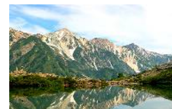
八方尾根自然研究路 (イメージ)

※「信濃路フリーきっぷ」でも9月1日~9月30日まで限定特典としてご利用できます。