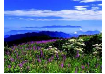
美ヶ原高原 (イメージ)