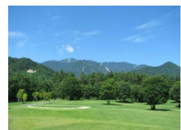
国営アルプスあづみの公園 <大町・松川地区> (イメージ)

※「信濃路フリーきっぷ」でも7月14日~9月30日まで限定特典としてご利用できます。(ただし、8月11日~20日は除きます。)