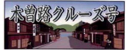
ヘッドマーク (イメージ)

木曾路を満喫していただける急行「木曾路クルーズ号」を運行します。各駅周辺の観光・散策・お買物等をお楽しみいただけるよう、名古屋駅からの下り列車は南木曾駅、木曾福島駅、奈良井駅にしばらく停車します。木曾福島駅、奈良井駅前では急行「木曾路クルーズ号」をご利用のお客様に向け、地元特産品の試食・販売等のイベントも実施予定です。