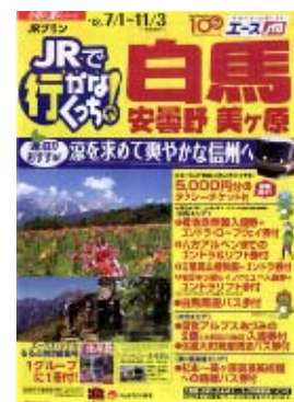
パンフレットイメージ