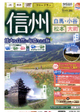
パンフレットイメージ