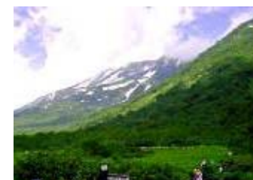
柵池自然園 (イメージ)

※「信濃路フリーきっぷ」でも9月1日~9月30日まで限定特典としてご利用できます。