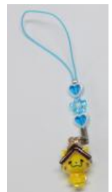
しまねっこポリストラップ ※イメージ

足立美術館にて「山陰めぐりバス」のご呈示で入館料割引 通常おとな 2,200円→2,000円