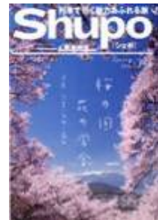
名古屋地区のJRの主な駅で 配布予定の冊子「Shupo」(春版) (イメージ)

2月27日（水）・28日（木）にJR名古屋駅中央コンコースで上記ツアー商品も紹介するPRイベントを実施します！