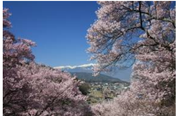
高遠城址公園の桜 (イメージ)