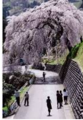
岩太郎のしだれ桜 (イメージ)