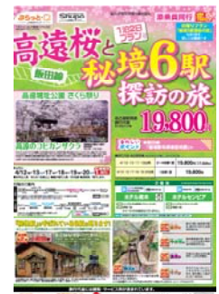
パンフレット (イメージ)