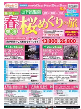
パンフレット (イメージ)