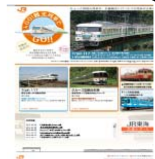
JR東海観光列車ホームページ 「Go!観光列車でGo!!」(イメージ)

http://shupojr-central.co.jp/train/index.html