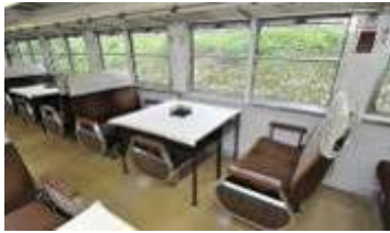
1・3・4号車内(イメージ)

2号車「ウィンディスペース」…ご乗車のお客様が自由にご利用になれるスペース。沿線の景色等をお楽しみいただけるように窓向きにベンチを配置し、乗降扉に代わって展望柵があります。