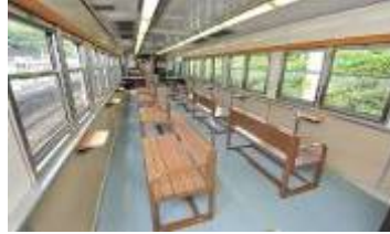
2号車(ウィンディスペース)車内(イメージ)