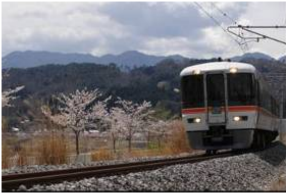
急行「飯田線秘境駅号」(イメージ)

日本さくら会の「さくら名所百選」にも選ばれた高遠城址公園のコヒガンザクラと、急行「飯田線秘境駅号」の車窓から眺める絶景や秘境駅6駅をお楽しみいただける宿泊ツアー商品をご用意しました。また、飯田線秘境駅6駅を巡る日帰りツアー商品もございます。