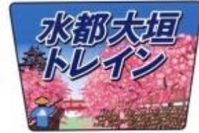
ヘッドマーク(イメージ)