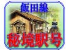
ヘッドマーク（イメージ）

この春も、飯田線の秘境駅6駅（ こわだ 小和田駅・ なかいさむらい 中井侍駅・ してぐり 為栗駅・ たもと 田本駅・ きんの 金野駅・ ちよ 千代駅）を訪れるのに便利な急行「飯田線秘境駅号」を運行します。下り列車でも上り列車でも、秘境駅6駅を巡ることができます！