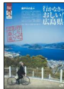
(歴史の見える丘公園)