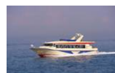
(呉・御手洗宝しまクルーズ)