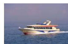
(呉・御手洗宝しまクルーズ)