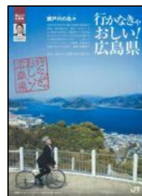
(歴史の見える丘公園)