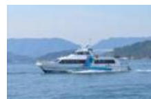
(広島湾宝しまクルーズ)

広島県内にある「瀬戸内の島々」、「観光地」などをスムーズに巡り、多くの「芸術」、「伝統」、「食」などを体感できるよう、広島DC期間中には「広島湾宝しまクルーズ」「呉・御手洗宝しまクルーズ」「広島市内観光ループバス ひろしま めいふる一ふ」など、2次アクセスを多数ご用意しております。詳細は別紙1をご覧ください。