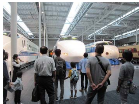
前回のイベントの様子