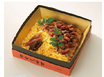
「抹茶ひつまぶし日本一弁当」