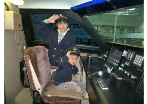
過去のイベントの様子 ※写真は100系新幹線運転台

普段は入ることができない300系新幹線（J21）と100系新幹線と、来年1月2日から展示を開始する700系新幹線の運転台を特別公開します。こども用制服を着用して記念撮影することができます。また、スタッフが撮影した写真を特製台紙に入れてお渡しするフォトサービス（有料）も行います。なお、300系新幹線（J21）の運転台公開はこれが最後となります。