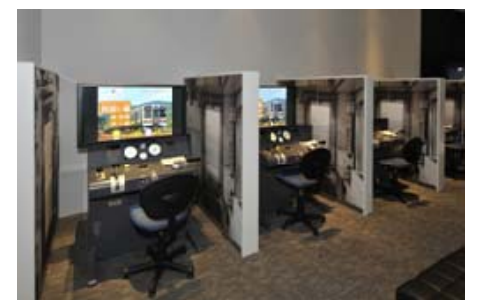
在来線シミュレータ「運転」