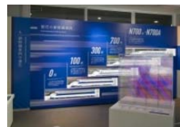
東海道新幹線車両模型