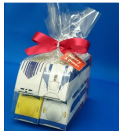
クラッチバーセット