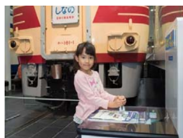
過去のイベントの様子