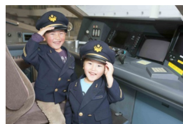
過去のイベントの様子

③ 参加方法：300系322形式新幹線のホームにて受付（先着順：各日約85組（※1組最大4名まで））