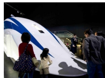
過去のイベントの様子