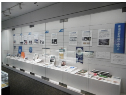
東海道新幹線の50年を収蔵品で振り返る