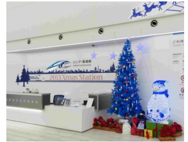
過去のイベントの様子

※年明けに鉄道ジオラマには正月をテーマにした期間限定のフィギュアを展示する予定です。