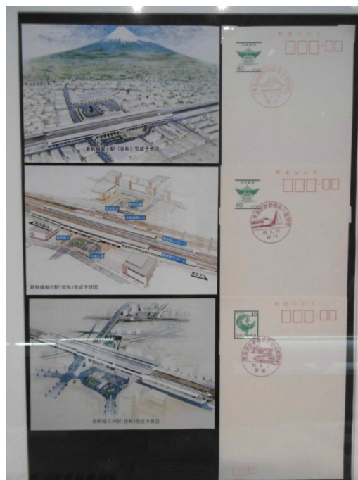
新富士・掛川・三河安城駅完成予想図絵葉書