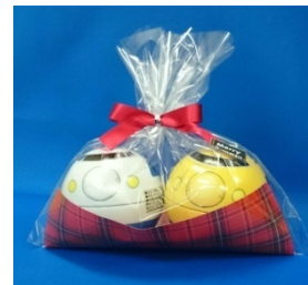
球体缶キャンディセット

このほか、来年1月2日（金）には、新春福袋を数量限定で販売します。詳細は12月下旬に改めてお知らせいたします。