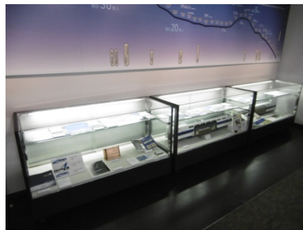
東海道新幹線の歴代車両に関する展示