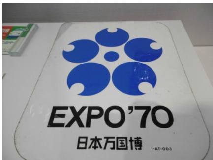
日本万国博覧会シンボルマークステッカー