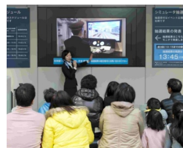
過去のイベントの様子

※教室はどなたでもご参加いただけますが、シミュレータのご利用は抽選制・有料です。