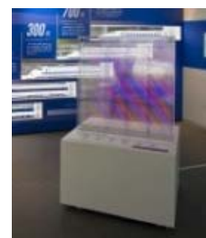
ダイヤの変遷モニュメント