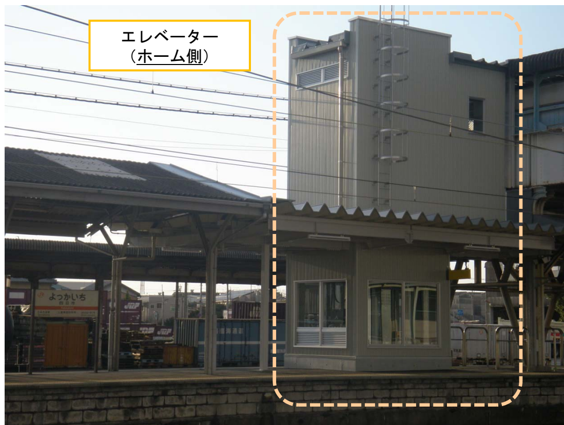
エレベーター (ホーム側)