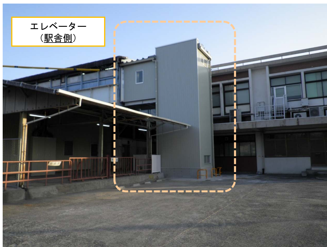
エレベーター (駅舎側)