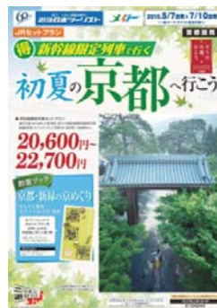
近畿日本ツリスト