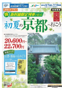
近畿日本ツーリスト 発売中

ジェイアール東海ツアーズその他、JTB、日本旅行、近畿日本ツーリストでも発売します。