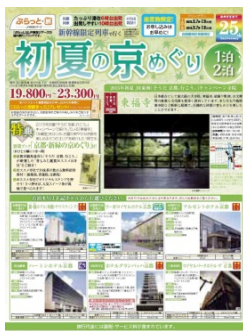
ジェイアル東海ツアーズ