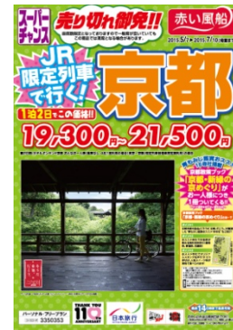
日本旅行 5月1日発売開始