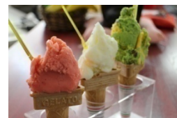
※レモンジェラートイメージ