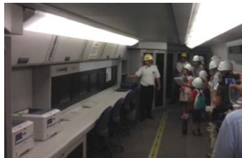
ドクターイエロー車内見学