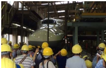
車両メンテナンスのお仕事紹介