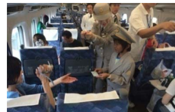
制服を着て車掌体験