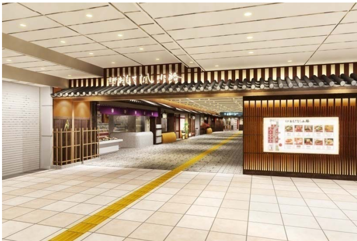
←八条口改札側エントランス