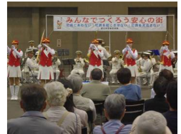
過去のイベントの様子