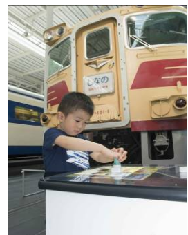
過去のイベントの様子