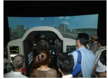
過去のイベントの様子