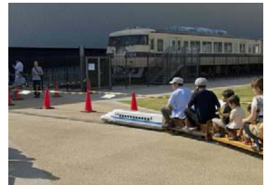
過去のイベントの様子