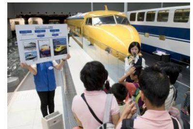
過去のイベントの様子