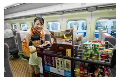
過去のイベントの様子