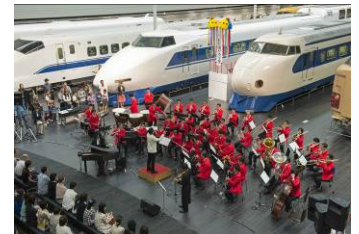
過去のイベントの様子