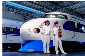
過去のイベントの様子