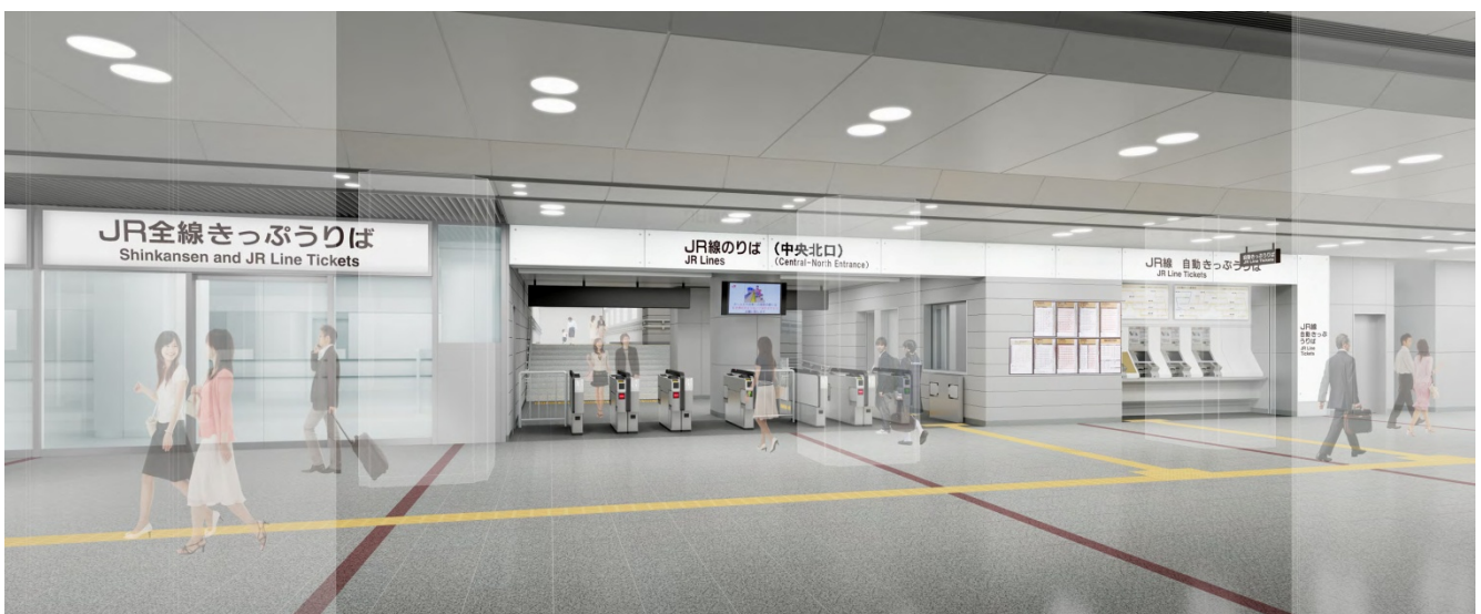
中央北口イメージ