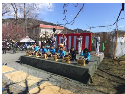
▲曾我地区の子供達による祭ばやしの演奏

【地元子ども達による祭ばやし (無料)】日時：2月27日(土) 13時頃～、15時頃～ 場所：別所会場