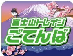
▲ヘッドマーク（1号車）