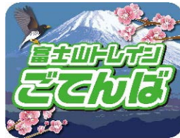
▲ヘッドマーク（3号車）