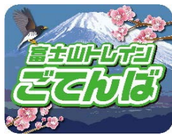
▲ヘッドマーク（3号車）