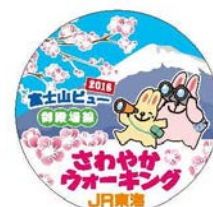
▲富士山バッジ (イメージ)

参加特典として先着1,000名様に、「富士山バッジ」をプレゼントします。 ※掲載のコース詳細については、さわやかウォーキングのパンフレット またはJR東海のホームページ ( http://walking.jr-central.co.jp ) をご覧ください。