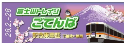
▲記念乗車証（下り：おもて）