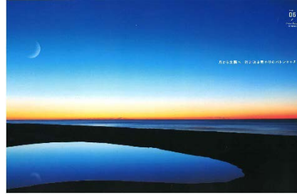
(左:静岡市 日本平、右:豊橋市 伊古部海岸)