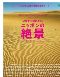
（左：冊子（特別仕様版）表紙、中：冊子中面※潮騒橋（掛川）、右：冊子（通常販売版）表紙）

詳しくは「Japan Highlights Travel」ホームページ ( http://japan-highlightstravel.com ) または、JR東海のホームページ ( http://jr-central.co.jp/ ) をご参照ください。