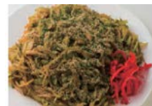
富士宮やきそば（富士）