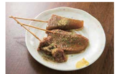
おでん盛り合わせ（静岡）