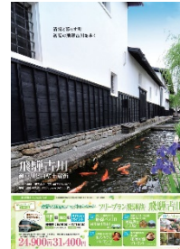
飛騨市 タイアップポスター