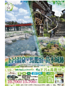
下呂市・中津川市 タイアップポスター