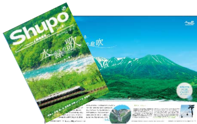
「Shupo [シュポ]」パンフレット

初夏の魅力あふれる列車の旅が楽しめるツアー商品などを掲載したパンフレットや、地元の皆様と連携したポスターを、JR東海の主な駅（一部駅を除く）で掲出します。また、名古屋駅の中央コンコースのデジタルサイネージでも、おすすめの観光地の情報を発信します。