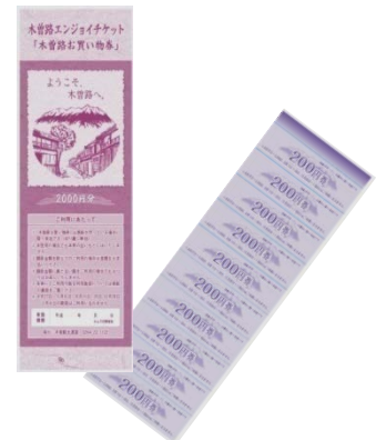
木曽路お買い物券