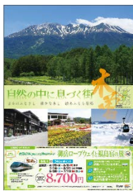
木曾町 タイアップポスター