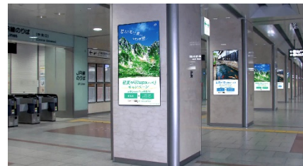
名古屋駅デジタルサイネージ