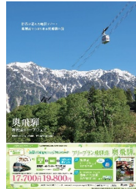
奥飛観光開発(株) タイアップポスター