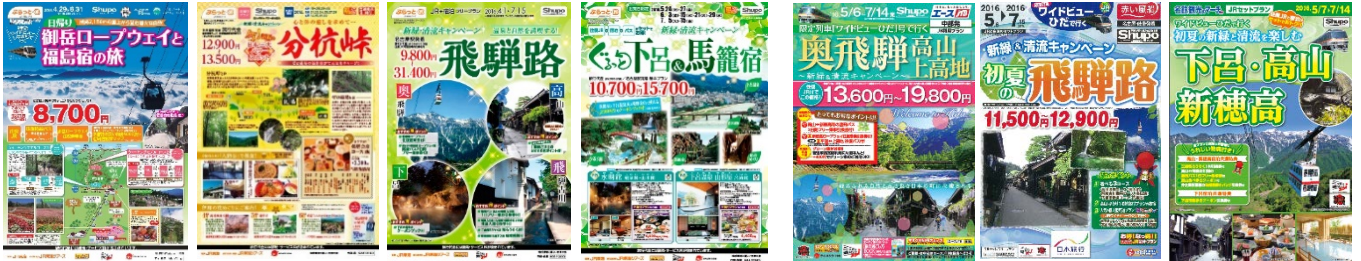
ジェイアール東海ツアーズ ツアー商品