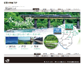
観光情報サイト 「Shupo [シュポ]」

キャンペーン専用ページを公開し、沿線にある初夏のおすすめの観光地などをご紹介します。(http://shupo.jr-central.co.jp/)