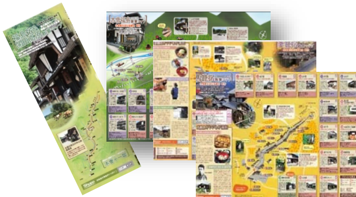
宿場町散策マップ