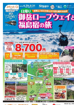
ツアー商品の一例