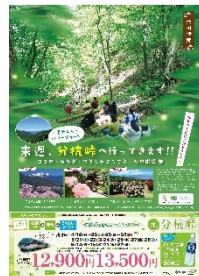
伊那市 タイアップポスター