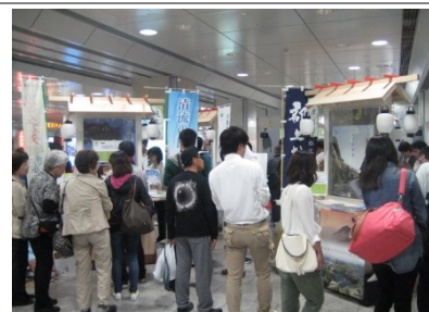
昨年度のイベントの様子