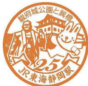
▲ぼぼちゃんスタンプイメージ