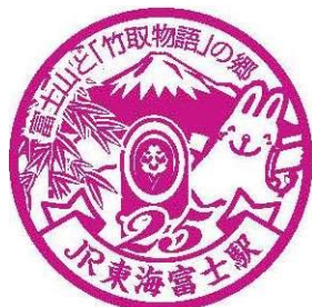
▲さわちゃんスタンプイメージ

★ スタンプとクイズの答えが揃うと、1か所達成。3か所達成させると、宿題完成です。