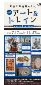
▲リーフレットイメージ