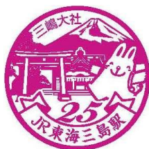
▲さわちゃんスタンプイメージ