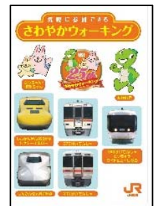
オリジナルシール