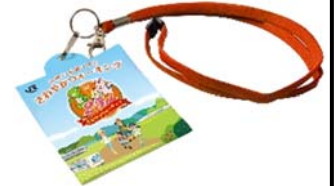
25周年記念 カードホルダー