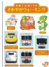
オリジナルシール