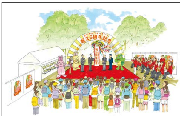
さわやかウォーキング25周年記念イベント会場イメージ