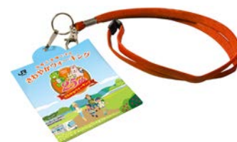
25周年記念カードホルダー