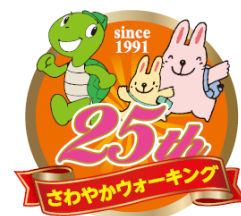
25周年記念ロゴマーク