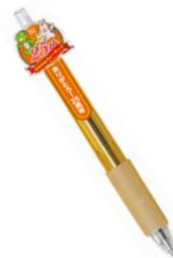
25周年記念オリジナルボールペン