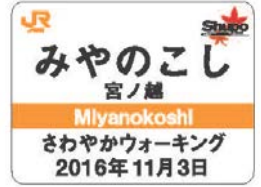
駅名バッジイメージ(全2種)