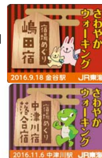
宿場めぐりバッジイメージ (全13種)