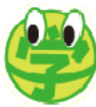
各コースのアイコン

※バッジデザイン等は変更する場合があります。 ※写真・イラストはすべてイメージです。 ※イベントは変更となる場合がございます。