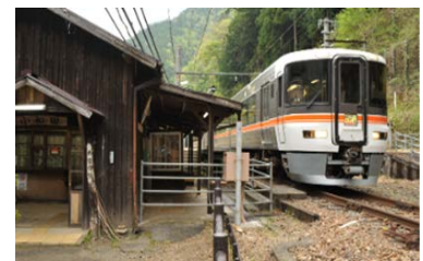
観光列車 急行「飯田線秘境駅号」