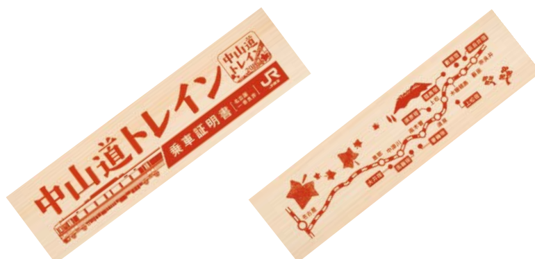
木曾ヒノキを使用した乗車証明書