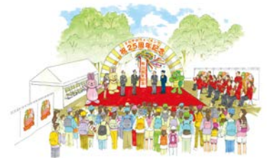
25周年イベントイメージ

◎関ヶ原のほか、静岡地区でも25周年記念コースを設定しています。詳細はホームページをご参照ください。