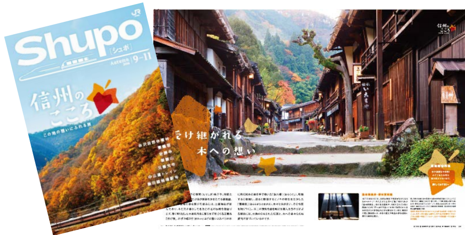
「Shupo[シュポ]」パンフレット

秋の魅力あふれる列車の旅が楽しめるツアー商品などを掲載したパンフレット・ポスターを、JR東海の主な駅（一部駅を除く）、列車内で掲出します。また、ホームページでも沿線の観光地を紹介しています。