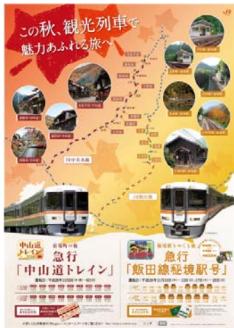
観光列車ポスター