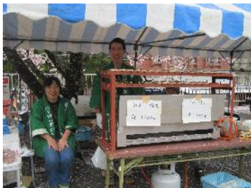
今春の平岡駅での特産品販売の様子