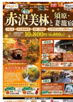
赤沢森林鉄道乗車や木曾の宿場町をめぐる周遊バスとセットになったツアー商品 パンフレット