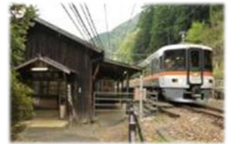
急行「飯田線秘境駅号」と小和田駅

◇運 転 日：平成28年11月10日(木)～13日(日)、 17日(木)～20日(日)(上下 各1本)