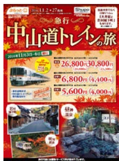
急行「中山道トレイン」利用のツアー商品 パンフレット