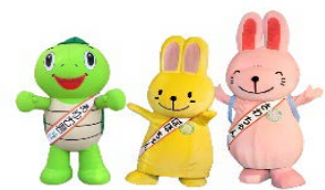
さわやかウォーキングマスコットキャラクター あゆむ君・団ぽちゃん・さわちゃん

今年25周年を迎えるさわやかウォーキングでは、第1回の開催地である関ヶ原にて「25周年記念コース」を開催します。当日は25年間の歴史を振り返る特別展示、JR東海音楽クラブによる演奏、お子様向けの制服を着用しての記念撮影など、25周年を記念したイベントを開催します。