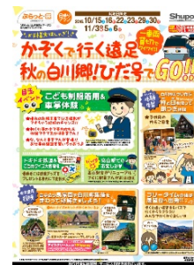
ツアー商品パンフレット かそくで行く遠足 秋の白川郷！ひだ号でGO!!

上記の観光列車をご利用いただくことができるツアー商品のほか、往復の特急列車と秋を満喫する観光地がセットになったツアー商品を多数ご用意しました。詳細は別紙をご参照ください。