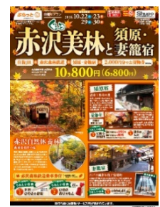
ツアー商品パンフレット ぐるっと赤沢美林と 須原・妻籠宿