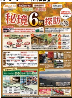
急行「飯田線秘境駅号」利用のツアー商品 パンフレット