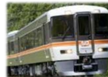
急行「中山道トレイン」

◇料 金：全車指定席の急行列車です。ご利用には、乗車券の他に急行券・指定席券が必要です。