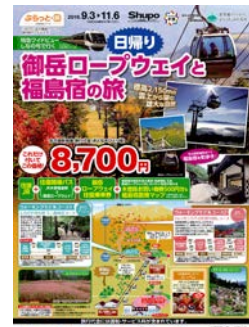
御岳ロープウェイ乗車や福島宿の散策が 楽しめるツアー商品 パンフレット