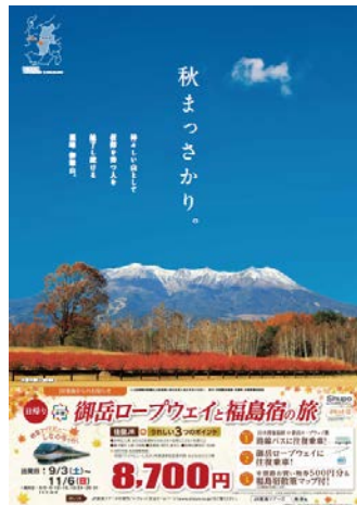
木曽町タイアップポスター