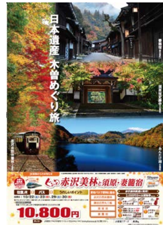
上松町・王滝村・大桑村・南木曽町タイアップポスター