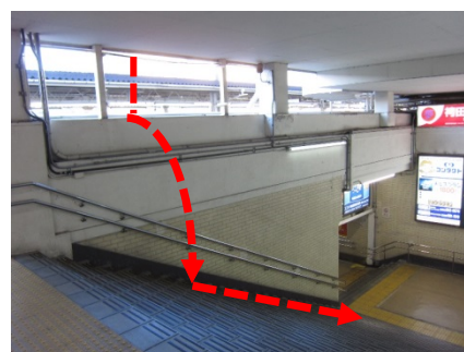
落下場所(通路階段部)