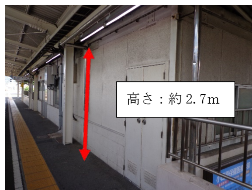
落下箇所（三島駅上りホーム）