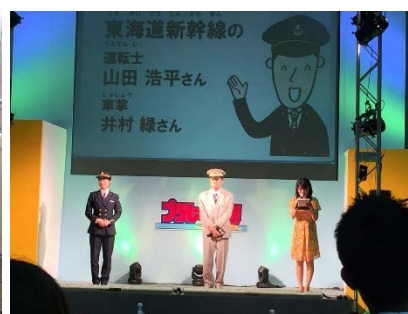
トークショーの様子