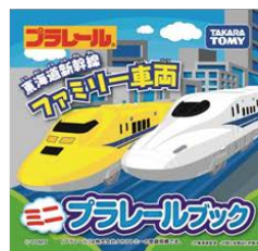
⑤ 「JR東海ミニプラレールブック」