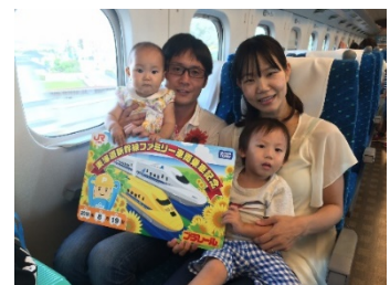
ファミリー車両の様子

※ご注意：1歳以上6歳未満の幼児はお席をご用意するため、幼児おひとり様の旅行代金が必要となります。1歳未満の乳児はお席をご用意しないため無料となりますが、お席をご希望の場合は幼児と同様に代金が必要となります。