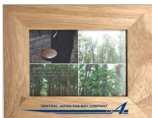
③ 「オリジナル新幹線フォトスタンド」