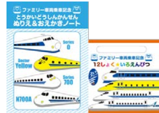
オリジナルお絵かきセット