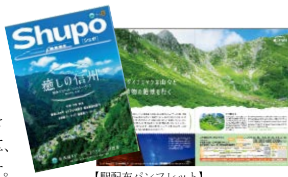
【駅配布パンフレット】

今夏のキャンペーンは「癒しの信州」をテーマとして、上伊那、南信州、木曾、白馬等を中心とした信州の魅力を発信するパンフレットを名古屋地区、東京地区、静岡地区、大阪地区のJR東海的主要な駅（一部を除く）で配布します。