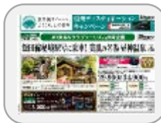
【クラブツーリズム】