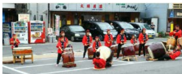
【昨年運行したいりどり木曽路号でのおもてなしの様子（南木曽駅）】