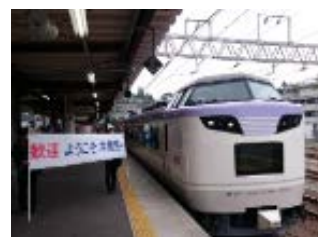
【昨年運行したいりどり木曽路号の様子】