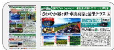
【クラブツーリズム】