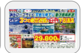
【クラブツーリズム】