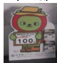
【カウントダウンボード】