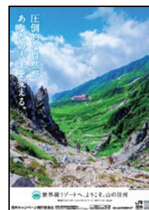
千畳敷カール乗越浄土