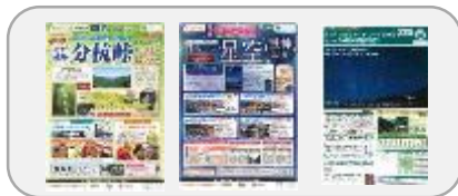
【ジェイアール東海ツアーズ】