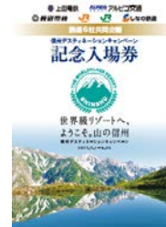
【信州DC記念入場券台紙イメージ】