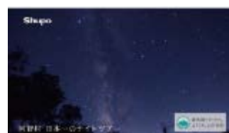
【日本一の星空※ (阿智村)】