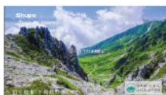
【千畳敷カール (駒ヶ根市)】