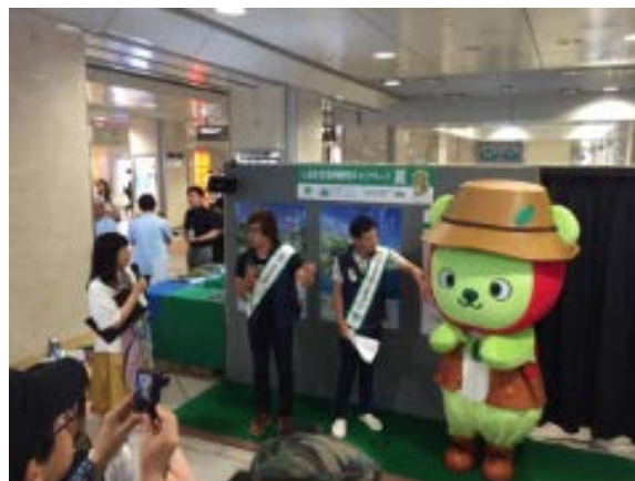
【昨年実施したイベントの様子】