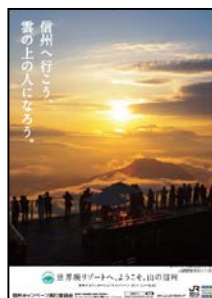
竜王マウンテンパーク SORA terrace からの夕日