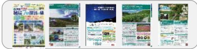
【ジェイアール東海ツアーズ】