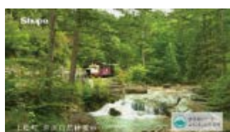
【赤沢森林鉄道 (上松町)】