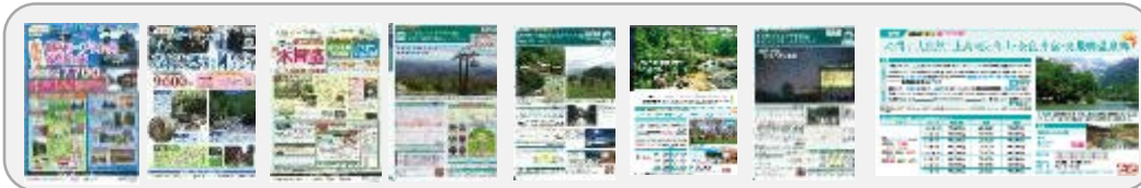
【ジェイアール東海ツアーズ】