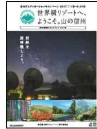
【キャンペーンガイドブック】

各エリアの観光情報やキャンペーン期間中に開催されるイベント情報などを掲載したキャンペーンガイドブックを全国のJRの主要駅や旅行会社窓口等で配布します。