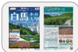
【ジェイアール東海ツアーズ】