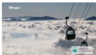
【御岳ロープウェイ (木曽町)】