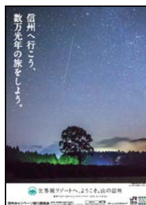
木曾開田高原の星空

信州キャンペーン実行委員会が制作した5連貼りポスターを全国の主な駅に掲出します。