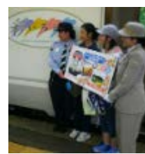
【昨年運行したいりどり木曽路号でのおもてなしの様子（列車内等）】