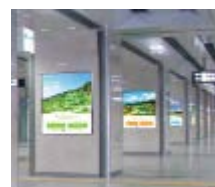
【名古屋駅デジタルサイネージ】