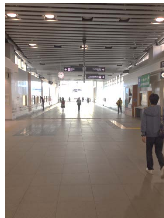
※松本駅東西自由通路発売箇所イメージ

※お買い求めいただけるセット数は各商品お一人さま2セットまでとさせていただきます。