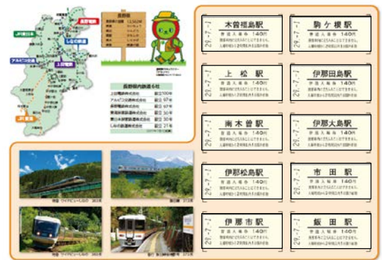
信州DC記念入場券台紙(中間)