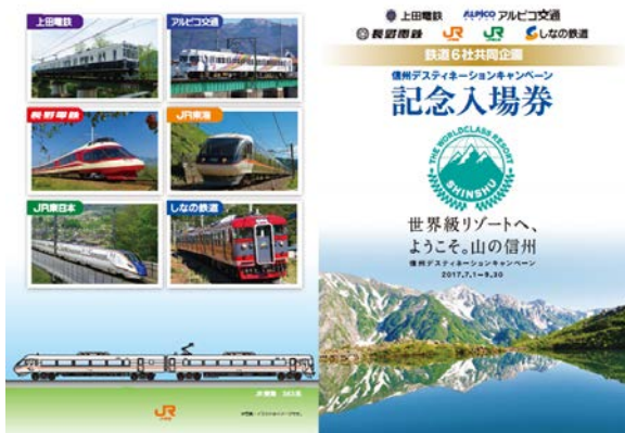
信州DC記念入場券台紙(裏・表)