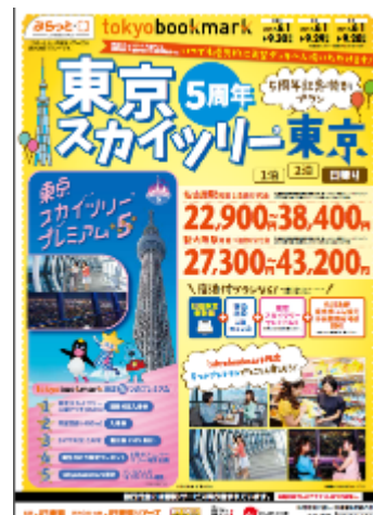
パンフレットイメージ