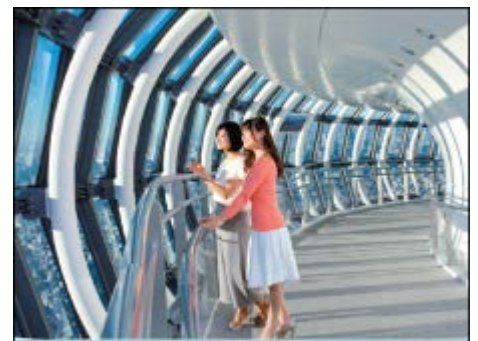
天望回廊イメージ