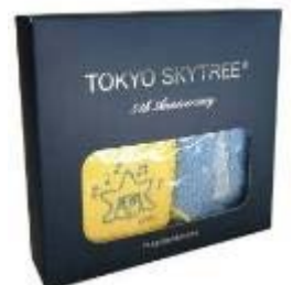
アニバーサリー特典 オリジナルハンカチ