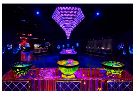
昨年開催の「アートアクアリウム2016」会場の様子