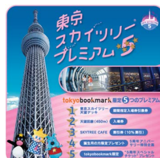
東京スカイツリー「プレミアム5」ロゴ