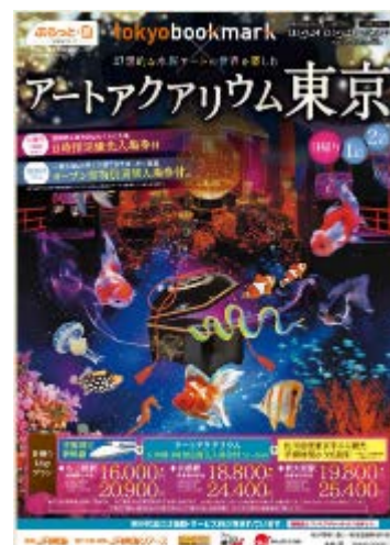
パンフレットイメージ