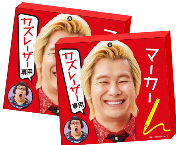
賞品「カズレーザー専用マーカー」