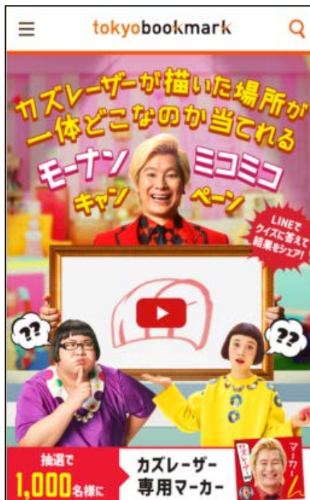
キャンペーンサイト

https://shinkansen.travel/tokyobookmark/theme/linequiz/index