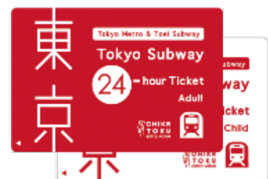
チケットイメージ