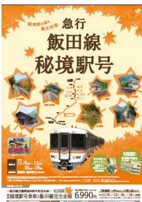
観光列車ポスター（急行「飯田線秘境駅号」） 掲載旅行商品「阪急交通社」