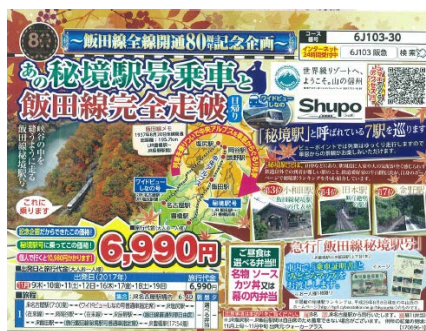
阪急交通社 「あゝ秘境駅号乗車と飯田線完全走破」