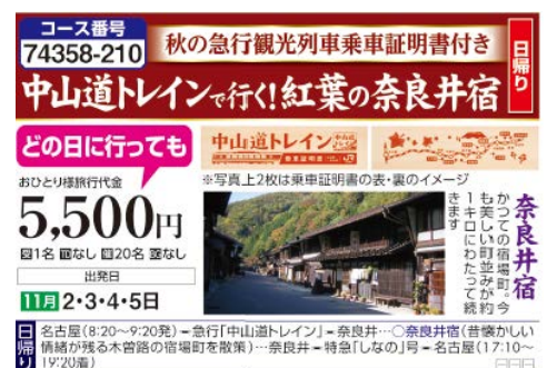
クラブツーリズム 「中山道トレインで行く！紅葉の奈良井宿」