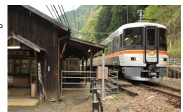
観光列車 急行「飯田線秘境駅号」