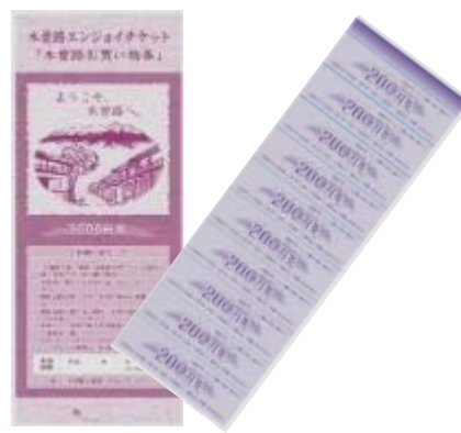
木曽路お買い物券

◎その他、きっぷのご利用にあたっての条件等については、JR東海のホームページをご覧ください。