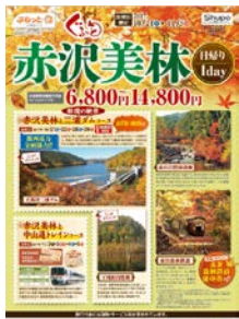
ツアー商品パンフレット ぐるっと赤沢美林