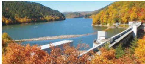
秘境の絶景「三浦ダム」