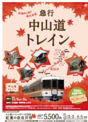
観光列車ポスター（急行「中山道トレイン」） 掲載旅行商品「クラブツーリズム」