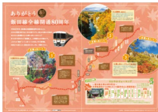
観光情報誌「Shupo[シュポ]」（飯田線沿線観光情報）