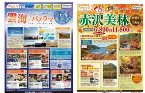
ツアー商品パンフレット 特急ワイドビューしなの号で行く 雲海とパノラマ 屋神温泉 ツアー商品パンフレット ぐるっと赤沢美林