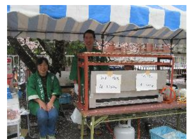
平岡駅での特産品販売の様子