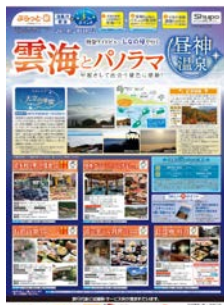
ツアー商品パンフレット 特急ワイドビューしなの号で行く 雲海とパノラマ 昼神温泉