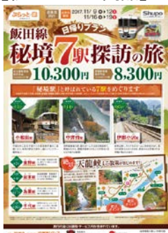
ジェイアール東海ツアーズ 「飯田線秘境7駅探訪の旅」