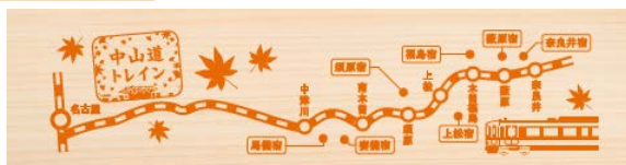
木曾ヒノキを使用した乗車証明書