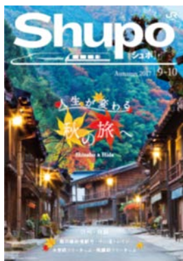
観光情報誌「Shupo[シュポ]」（表紙）

秋の魅力あふれる列車の旅が楽しめるツアー商品などを掲載したパンフレット・ポスターをJR東海の主な駅（一部駅を除く）、列車内で掲出します。また、ホームページでも沿線の観光地を紹介しています。