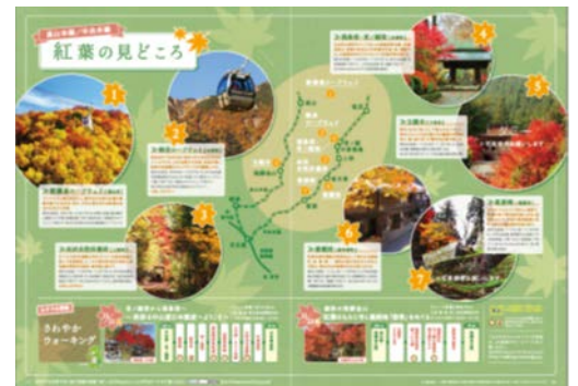
観光情報誌「Shupo[シュポ]」（中央線・高山線沿線観光情報）