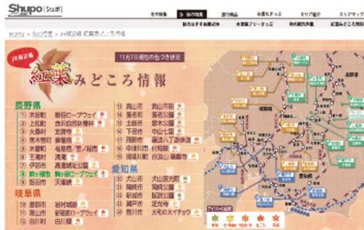
観光情報WEBサイト「Shupo [シュポ]」