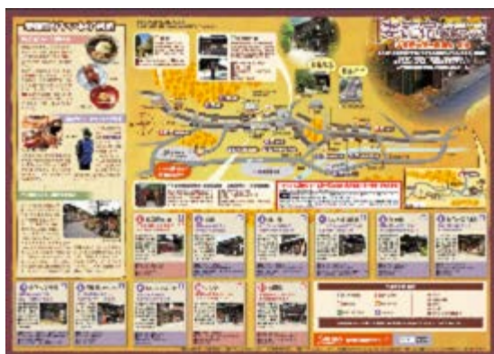
宿場町散策マップ

※「木曽路エンジョイチケット」及び「木曽路お買い物券」の引き換え時に「宿場町散策マップ」をお渡しします。