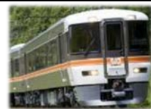
急行「中山道トレイン」

◇料 金：全車指定席の急行列車です。ご利用には、乗車券の他に急行券・指定席券が必要です。