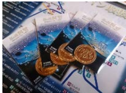
阿智村専用地域通貨「スターコイン」