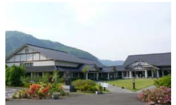
身延町なかとみ和紙の里

※身延町なかとみ和紙の里ホームページ( https://www.town.minobu.lg.jp/washi/ )