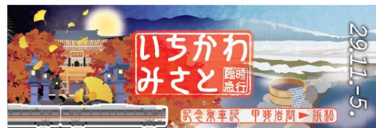
記念乗車証(上りおもて)