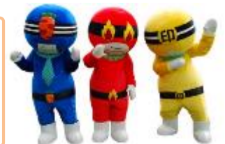
市川三郷町レンジャー

子供からお年寄りまで誰にでも親しめるわかりやすいキャラクターとして誕生しました。それぞれのキャラクターの顔は、町の特産品でもある大塚にんじん、花火、印章をイメージしています。