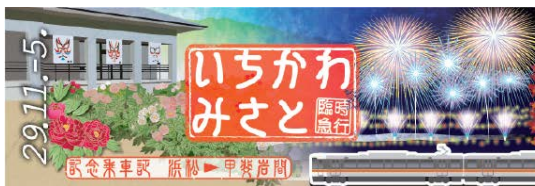
記念乗車証(下りおもて)