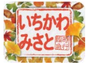
特製ヘッドマーク