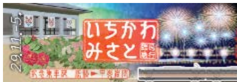
記念乗車証（下りおもて）