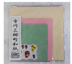
ノベルティ(和紙の折り紙)