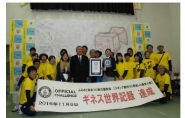
ギネス世界記録達成(昨年)