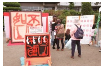
「はんこ日本一 六郷の里秋まつり」会場

(六郷支所庶務係) Tel.0556-32-2111 (商工観光課観光係) Tel.055-240-4157