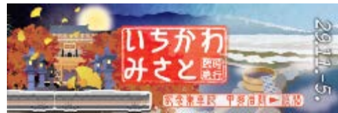
記念乗車証（上りおもて）