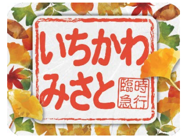
特製ヘッドマーク