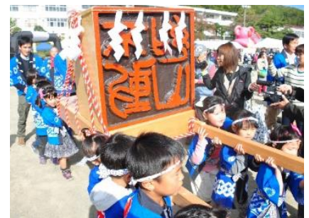
「はんこ日本一 六郷の里秋まつり」の様子(昨年)