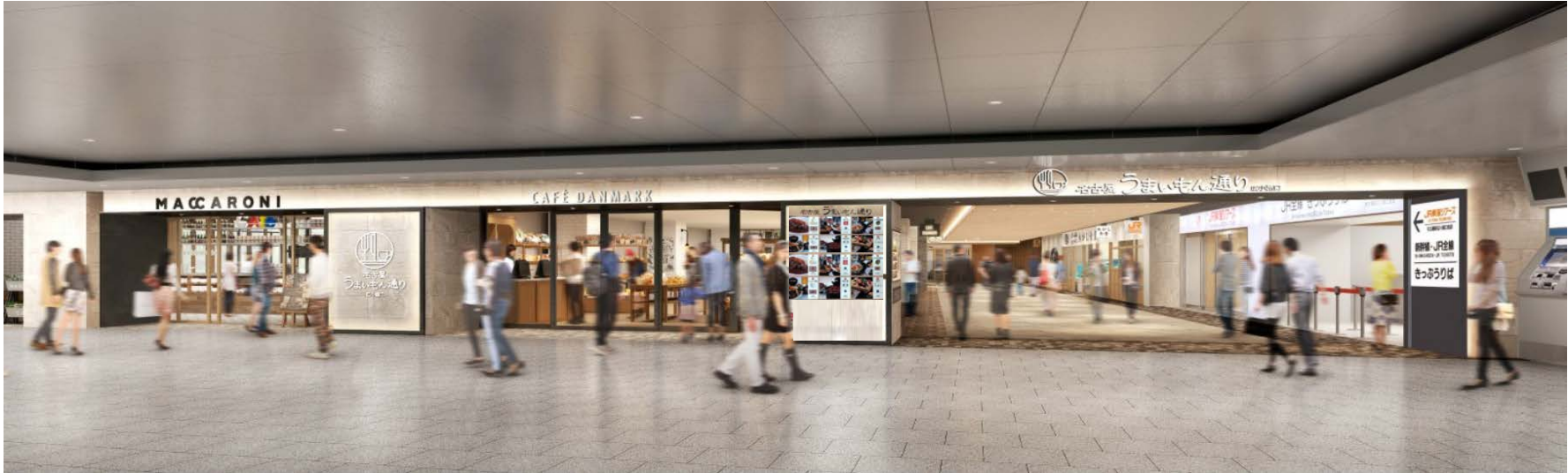
〔広小路口改札付近エントランス〕