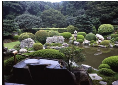
清水寺 成就院 月の庭