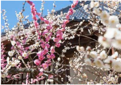
相国寺 林光院 鶯宿梅