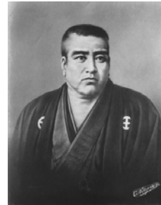
西郷隆盛肖像画