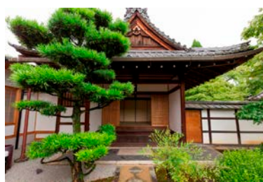
相国寺 豊光寺（外観）