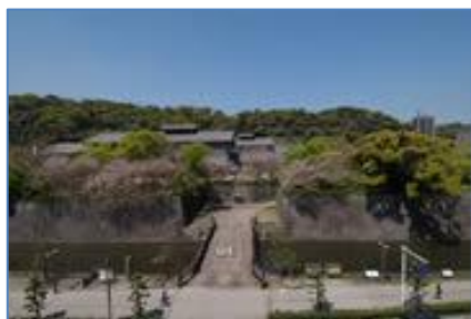
鹿児島市内（鶴丸城跡）

※まち歩きに参加できなかった場合は、鹿児島中央駅インフォメーションにて、西郷隆盛をモチーフにしたグッズと引き換えることができます。