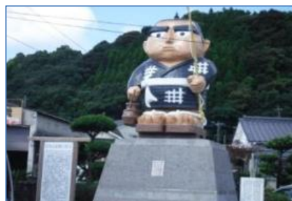
霧島市内（西郷どん像）