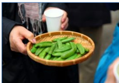
指宿市内（スメ料理）