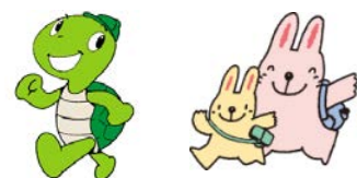
あゆむ君 ぼぼちゃん さわちゃん

※静岡プレDC記念コースの詳細等は、決まり次第、別途プレスリリースにてお知らせいたします。