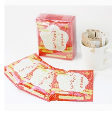
猿田彦珈琲のみちひらきブレンドドリップバッグ