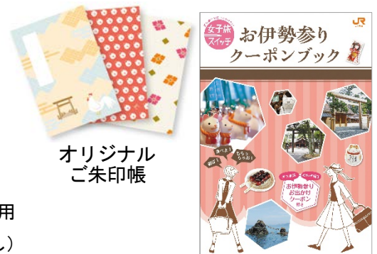
オリジナル ご朱印帳

* JR東海ツアーズでもご朱印帳・お伊勢参りクーポンブック付きプランを発売しています