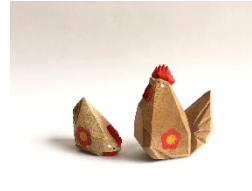
伊勢一刀彫り 一刀彫 結・太田結衣 『神鶏』