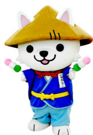
いせわんこ (三重県菓子工業組合)

ポスター・パネル展示・ご当地キャラクターの登場、その他体験コンテンツにより、多方面から伊勢志摩観光の魅力をご紹介します。