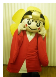
はなてらすちゃん (伊勢市観光PRキャラクター)