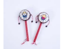
いせわんこグッズ (でんでん太鼓)