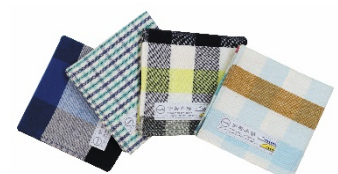
伊勢木綿オリジナルハンカチ