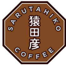
猿田彦珈琲のロゴマーク