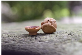
伊勢根付 梶浦明日香 『丸ネズミ』『一杯の中』