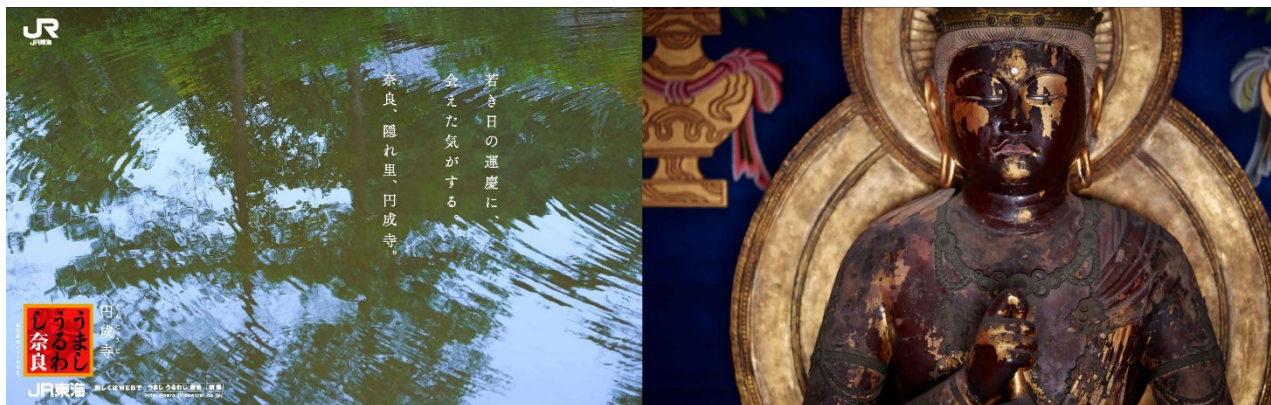
円成寺が所蔵する運慶作の国宝・大日如来坐像 ※写真はイメージです

※50+（フィフティ・プラス）の旅行プランお申込みには、会員登録（入会金・年会費無料）が必要になります。同行者の年齢制限はありません。