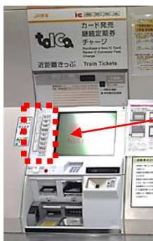
【近距離用自動券売機】