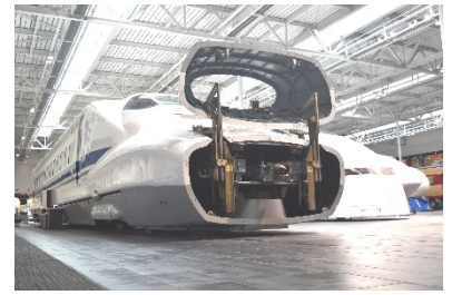
700系新幹線（イメージ）