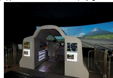
新幹線シミュレータ「N700」