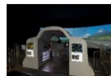
新幹線シミュレータ「N700」