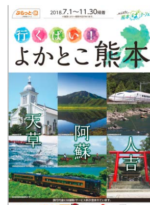
パンフレットイメージ

【問合せ先】 ジェイアール東海ツアーズ ふらっと旅・コールセンター 0120-945-355 （受付時間、平日 10:00～20:00、土日祝 10:00～18:00 迄）