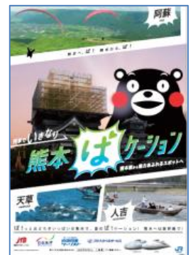
B1 ポスター ビジュアルイメージ

復興のシンボル熊本城は着実に復旧中。そしてそこから程近い熊本駅からは県内の魅力ある観光地へのアクセスが便利。復興、そして魅力ある熊本を、代表的なキャラクターでもある「くまモン」も登場し、楽しい「ば」ケーションを過ごすことのできる場所としてアピールしています。