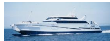
熊本フェリー オーシャンアロー

通常販売価格 大人 1,000円、子供 500円 → 大人 500円、子供 250円