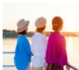
サンセットクルーズ