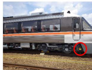
手歯止め搭載位置