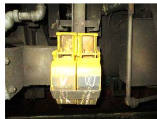
手歯止め搭載状態 (正常状態)