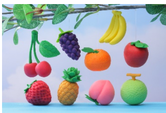
フルーツ消しゴム (はままつフルーツパーク時之栖)