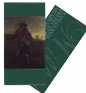
オリジナルチケットホルダー (山梨県立美術館)