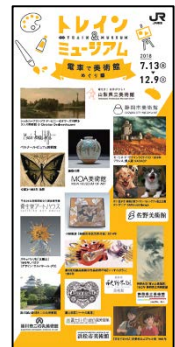
▲リーフレットイメージ