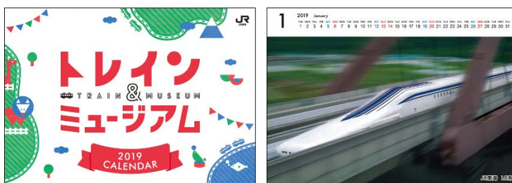
▲オリジナル卓上カレンダーイメージ