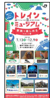
▲リーフレットイメージ