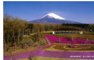
ポストカード (富士山樹空の森)