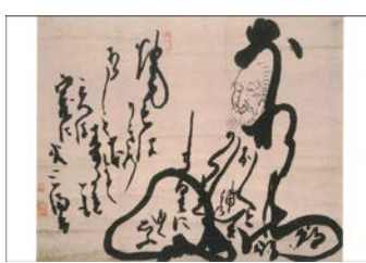
オリジナルポストカード (佐野美術館)