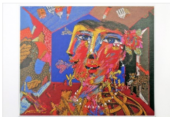
ポストカード (資生堂アートハウス)