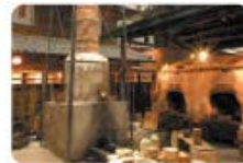
瀬戸蔵ミュージアム