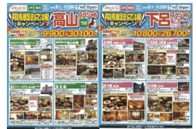
配布する旅行商品パンフレット(イメージ)