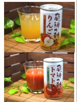
配布するジュース(イメージ)